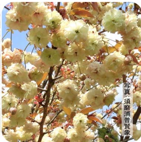
写真 須磨浦普賢象